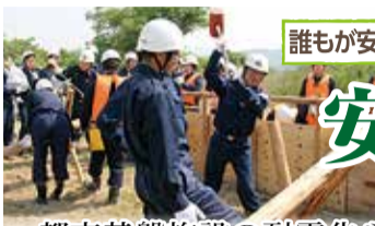
誰もが安全で安心できるまちづくり

5つのキーワードごとに、目指す都市像「緑豊かで健康な文化田園都市」の実現に取り組みます。具体的な事業は、2-5面の予算特集で紹介します。