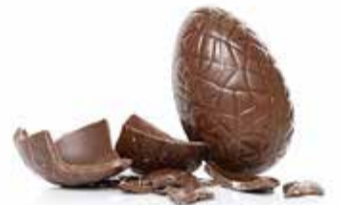
④リミントンの実家に咲くスイセン ⑤イギリスの春の定番・卵形のチョコレート