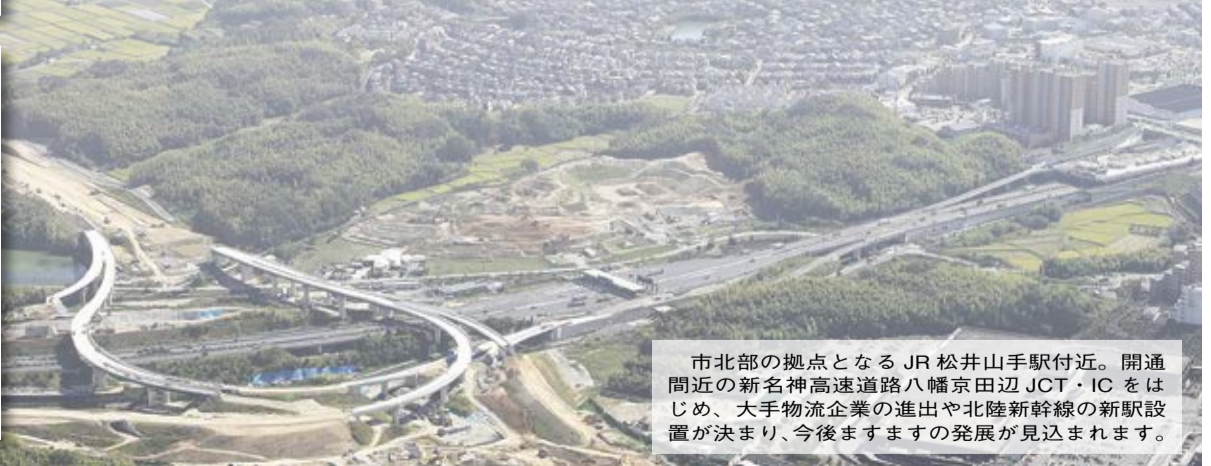
市北部の拠点となるJR松井山手駅付近。開通間近の新名神高速道路八幡京田辺JCT・ICをはじめ、大手物流企業の進出や北陸新幹線の駅設置が決まり、今後ますますの発展が見込まれます。

を持ち、積極的にチャレンジする意欲と行動力を持つ職員を育成します。 さらに、まちづくりの重要なパートナーである同志社大学・同志社女子大学との連携をこれまで以上に強化することで、大学が持つ豊富な人材や知的資源をまちづくりに生かしてまいります。