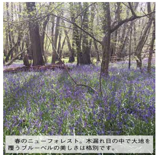
春のニューフォレスト。木漏れ日の中で大地を覆うブルーベルの美しさは格別です。

ント)」と言われていたそうです。レントとはキリスト教の春の習慣で、約40日間にわたって生活習慣の改善を行うものです。