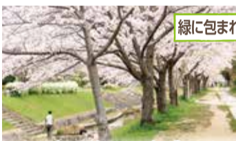
緑に包まれた環境にやさしいまちづくり

都市基盤施設の耐震化や、共助の拠点となる避難所の充実・運営強化を一層進めるとともに、備蓄機能を併せ持つ「防災広場」の整備など、さらなる防災・減災対策に取り組めます。