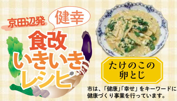
市は、「健康」「幸せ」をキーワードに健康づくり事業を行っています。

今号は、たけのこと菜の花を卵でとじた、春の香りいっぱい優しい味わいの一品を紹介します。京田辺産のたけのこは、ほのかな甘さがあり、柔らかく歯触りが良いのが特徴です。