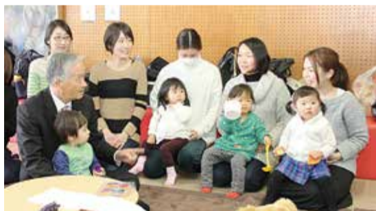
2月15日、社会福祉センターで開かれた妊娠・子育て中の保護者の交流の場「いつでもだれでも」。子育てについての率直なご意見をいただきました。

これまで、安全・安心と子育て支援に重点を置いたまちづくりを進めてきました。子どもを育てながら働く世帯の転入が続く本市では、子育ての負担感を和らげる取り組みがさらに必要と