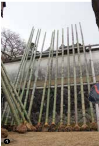
① 枝葉に残る雪を浴びながらの掘り出し作業②ふるさと体験学習として毎年参加する普賢寺小学校の児童ら③石井市長を先頭に、大勢の奈良市民が待ち受ける東大寺転害門に到着④無事に二月堂に納められた真竹⑤3月に二月堂で行われるお水取り(修二会)で、勇壮な炎を上げる籠松明(過去の様子)。