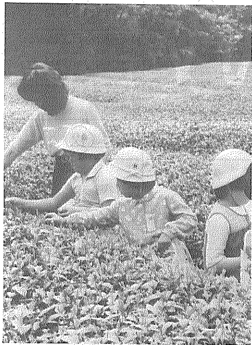
初体験で大丈夫かな

住民ならぬ方が目立ち、年研修訪日団の研修生三人も飛び入り参加して、一般戦しました。