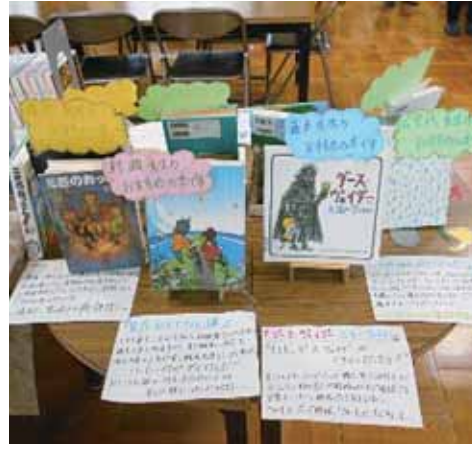
学校司書が配置したおすすめ本のコーナー

○ 小中学校に、1校1名の学校司書の配置を。 ①雇用にあたっては、専任・専門・正規での配置を。 ②図書データベース化の進捗状況は。 〔教育部長〕 ③授業実践に当たって、学校司書の役割や関与状況を見て検討したい。④今後も、非常勤嘱託職員としての形態で配置していきたい。