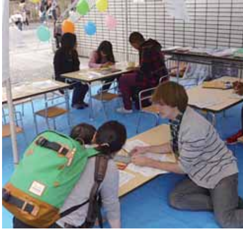
市内で活躍されるALITのみなさん

○ 外国人居住者のために医療通訳制度の確立を。実際にはニーズが生じている。 〔市民部長〕 京都市と枚方市にあるが、資格制度がないこと、言語力・文化理解・医療知識を兼ね備えている人が非常に少ないことから、市内在住外国人30カ国ぐらいの通訳を確保することは至難の業と考えている。 ○ 市がALITに提供している住宅は、交通の便が悪く近くにスーパーやコンビニもないことなどから代々不評。転居希望を伝えても、住居探しや保証人の確保、実際の引っ越しは各自の責任とされるため、思い止まる人も多い。こうした対応は、近隣市町の中で本市が最悪。改善を。 〔教育部長〕 嗜好や生活状況