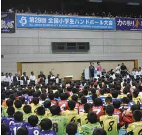
全国小学生ハンドボール大会の開会式

○ 企業誘致が本市を豊かにする。大住工専拡大事業において治水対策は不可欠。府による河川改修工事の早期完成を。また、雇用の拡大も重要だが、市内で勤務する市民の状況と、市内企業数は。 〔市長〕 本市の豊かな未来につなぐ、魅力ある施策や事業展開には、安定的な財源確保が必要であり、企業誘致と雇用拡大は有効な手段と考える。新名神の開通を生かし、大住工専拡大事業と企業誘致に取組み地域活性化につながる道路整備、治水対策を推進する。 〔経済環境部長〕 市内で就業する市民の割合は約30%で、市内事業所が約100、従業員は約2000人増加した。 ○ 平成29年に30回を迎える全国小学生ハンドボール大