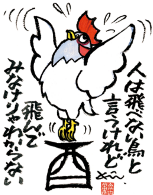
【西、受験生への新春メッセージ】