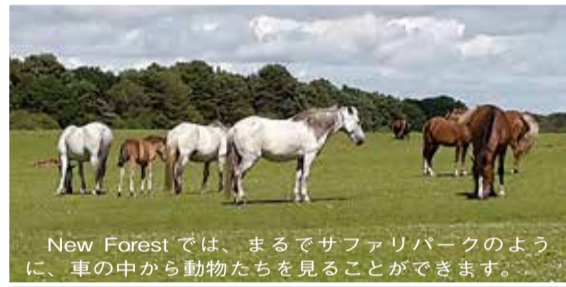
New Forestでは、まるでサファリパークのように、車の中から動物たちを見ることができます。

町の中心には、18世紀の建物が現存し中世の雰囲気が残るHigh Street(ハイ・ストリート=大通り)があります。