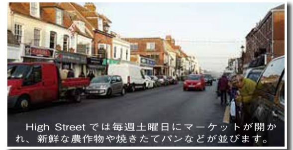
High Streetでは毎週土曜日にマーケットが開かれ、新鮮な農作物や焼き立てパンなどが並びます。

また、町の北にはNew Forest(ニュー・フォレスト)と呼ばれる国立公園があり、牛や馬たちが自由に歩き回っています。しかし、動物たちは道路の真ん中で立ち止まって動いてくれないことがあり、学校に遅刻することもよくありました。