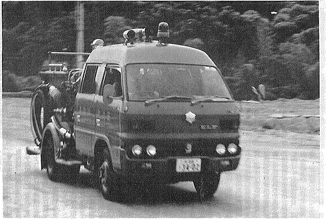
近年とくに出動回数が増加している

ことしで第十一回目を迎える「夕涼みのつどい」は、八月十六日、午後六時から馬坂川畔(府立田辺高校西側)で開催します。雨天の場合は順延。 この催しは、新旧住民の融和のためコミニケーションの場として、真夏の一夜を楽しく過ごしていただくことを目的としています。 「ふるさとの夜空にひらく帯と新田辺東住宅の一部が、真夏の祭典」と決まりました。これは田辺町夕涼みのつどい実行委員会が公募したもので、多数の応募をいただいた中から、田辺町松井ケ丘一丁目二十七から十時までの間、対面通場の混雑が予想されますので、できるだけ電車やバスをご利用ください。 当日は、府立田辺町地一、国道三〇七号線から府立