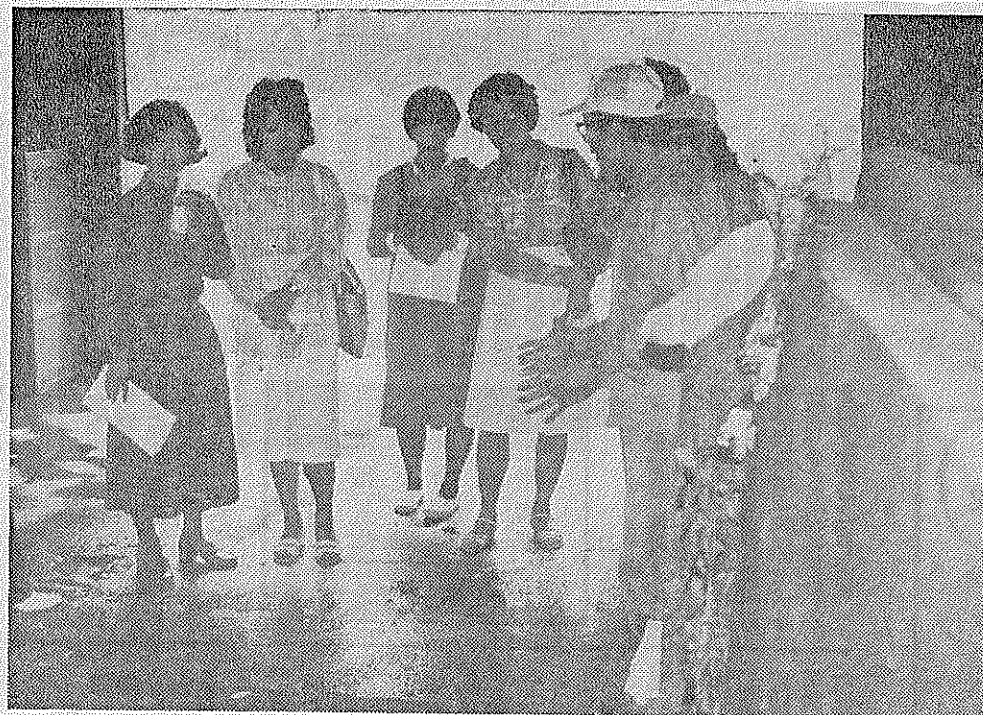
甘南備園を見学するモニターの方たち

町政モニターは、町政の現状や改善の要望を町政に反映させるという目的で実施されています。 座談会では、町政モニターの方々が平素考え、感じている町政の現状や改善の要望を町政に反映させるという目的で実施されています。