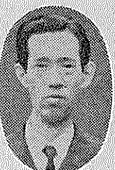
役立つ式の簡 橋 隆 三山木 (57) デザイ