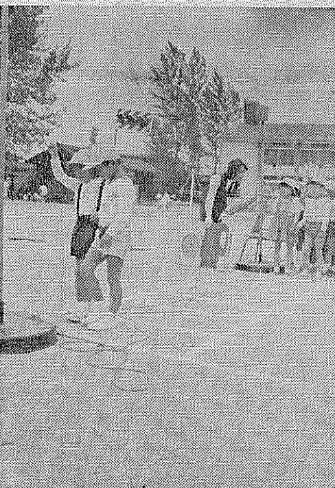
園児たちに交通ルールを教える町婦人交通指導員(草内小)