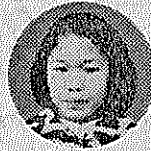
松井ケ丘幼稚園 村、それには春にきた大住団地には、交がきし...