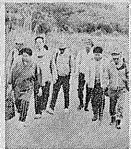
悪天候で参加少数でも、楽しい一日

悪天候で参加少数でも、楽しい一日 古川町教育委員会主催の町内コンテストが行われました。