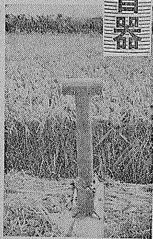
何か名案はありませんか