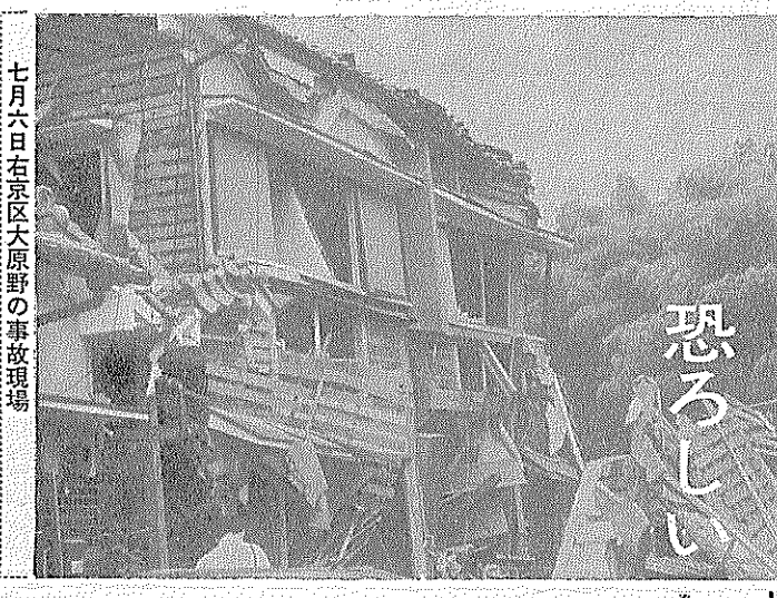
七月六日右京区大原野の事故現場

さる七月十三日にオープンの後冷房のきいた涼しい研修室や図書室で、連日多数のみなさんに利用されています。その後の中央公民館 申し込みは 申し込みは 申し込みは