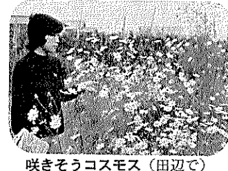
咲きそうコスモス(田辺で)

「ムシロ織り」も、激しく移り変わる歴史のなかで、残念ながら消え去ろうとしている現状です。 ふるさと田辺の伝統産業