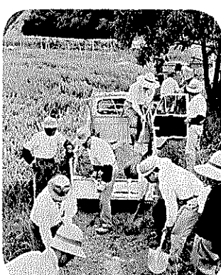
道路のデコボコをならしたり雑草の刈りに精を出す(天王)