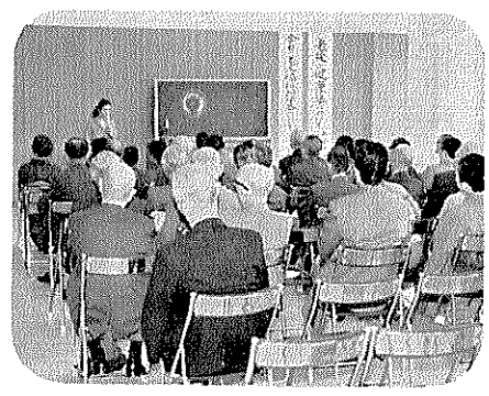
真剣なまなざしのお年寄たち

去る十月十一・十二日の二日間、町農協会館で、老人大学が約百五十名の参加者を集めて開かれました。 この日集った人たちは、激しく移り変わる社会の中で、老人は、どのように時代の流れに対応した生き方をすればよいかなど、若者に負けない真剣なまなざしで勉強しました。