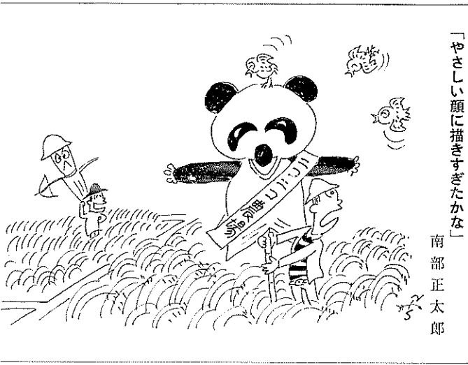
「やさしい顔に描きすぎたかな」

この町は、農家の若者たちが、農業をさらうため後継者がほとんどないと叫ぶたぐあいです。 これも、農業による収入が不安定であることが主な理由であり、また、企業での労働力不足も原因といえます。 農業収入の安定化をはかるには、地域的に農業生産物の流通機構の整備をはからなければなりません。 さらに、農家が他産業なるとともに、米作中心の農業から地域の特性を活かし、特産物の生産奨励をはかり、もうかる近代的な農業として、その体質を改善する必要があります。 そのためには、まずこの町の農業の振興をはかる地域を明確にして、土地利用の高度化と農業の近代化の会」も発足しました。