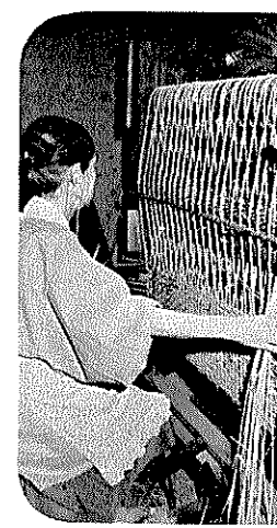
消えつつあるムシロ織り(新)

……いまやともしび とんち和尚さんで世にも有名な冬休の農閑期の内職として、おひざもとの薪地区の婦人に「ムシロ織り」を教しえてから約五百年を経た現在