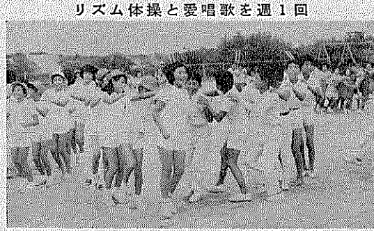
リズム体操と愛唱歌を週1回

月読神社の森が、さわやかな風にかがやく大住の中央——その高台に大住小学校が建っています。