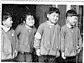
田辺三山木保育所 41年度保育児募集 申込みは 41.1.10~1.17 くわしくは、各保育所または役場住民課まで