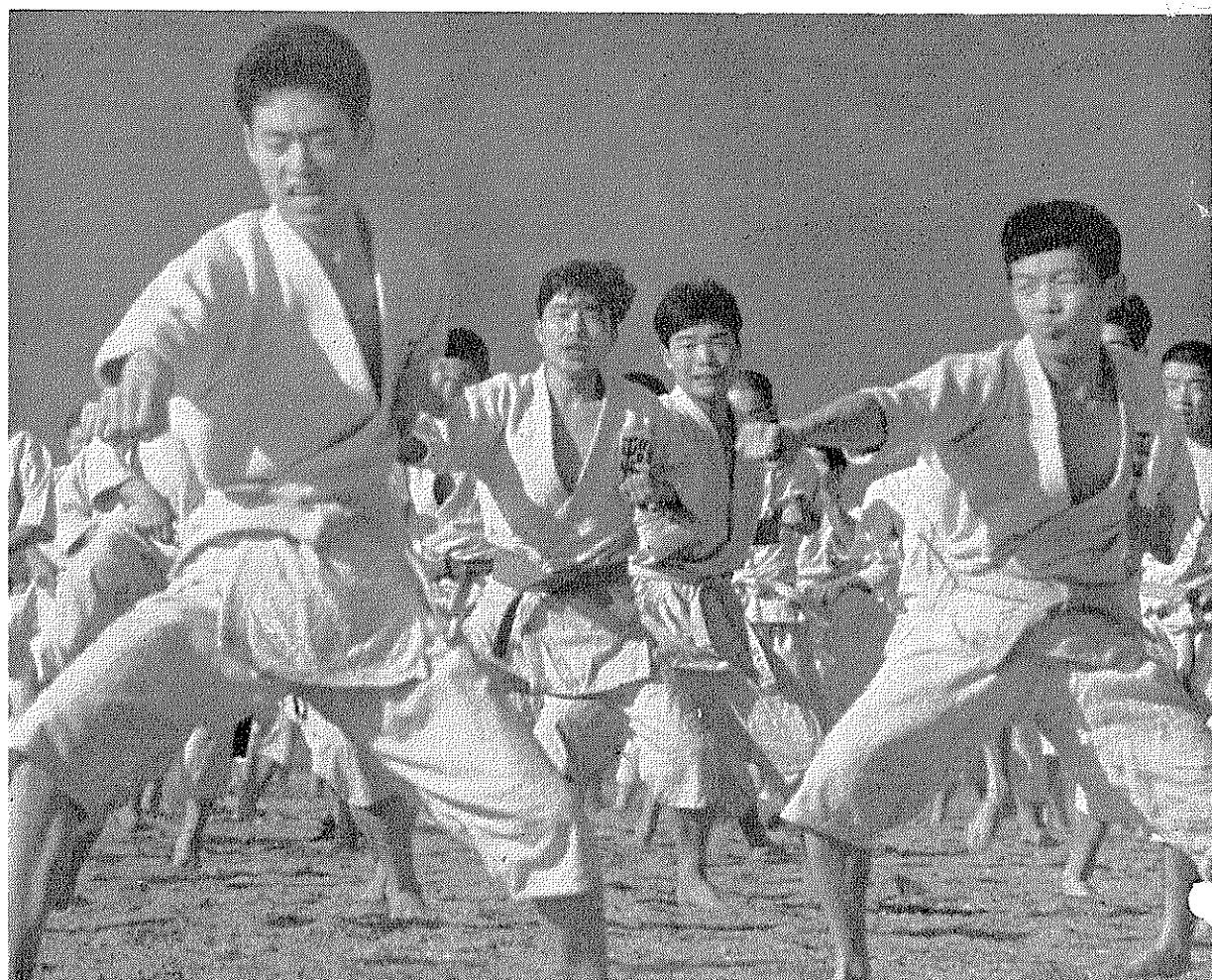
明日をつくる仲間たち……………