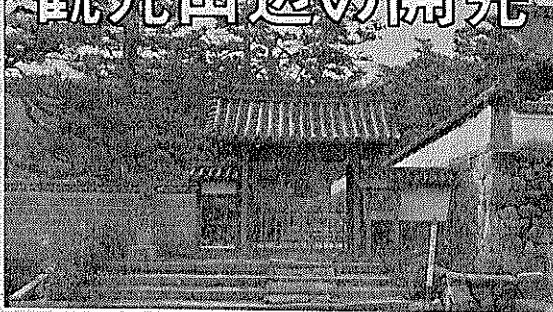
写真は室生犀星がたまたま来た一休寺

「レジャー」とか「バカンス」ムードにのって、日本はここ数年、かつてない観光ブームです。人びとは俗化した地をさけて、秘境をさぐったり、へんぴなところの観光地をもとめ歩く。本号は秋にふさわしく郷土の歴史と文化のあどをしのび「観光田辺の開発」と題して、ささやかなペンとカメラの第1回ルポをおとどけしよう。