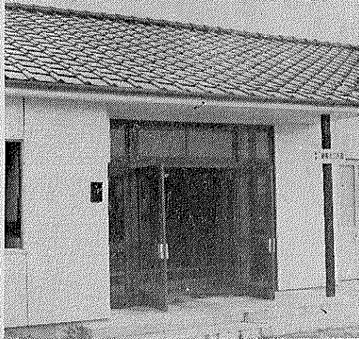
第2室戸台風で全壊し地元の熱意で復旧した近代的な公民館