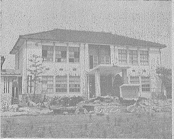
新庁舎落成式の様子

はらばらに押し進んで居りました。前途はよい交り多岐であ るが、合併後四年を経過して、一応は合併町としての の形も整い、仕事も軌道に乗つたといふ事は出来ませんが、然し今後の四年間 は実に多岐多岐な事がありまして、過去の四年間よりむづかしいのでは ないかと考へます。本町が山城の中心地としての基盤を確立し、そしてほとん どに平和な、住みよい理想郷たり得るや否やは、実はこの期間における町政の運 営如何にかゝつていふ事は私に信じます。そこで、この期間になすべき事、また なされねばならぬ問題のちから、その主なものを掲げてみましょう。