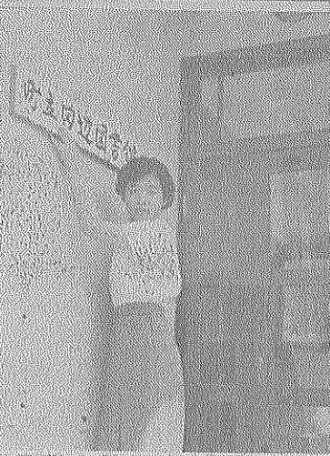
一行の田辺図書館

町教育委員会、町民の文化生活を高揚するために、このほど町立図書館(町立図書館)が建設された。同図書館は七月二日の開館を目前に、早くも図書の開架、貸出しの準備が完了し、町民の利用を待っている。