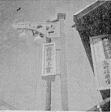
新田辺駅前通りのすずらん燈