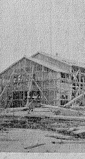
中学校講堂兼体育館