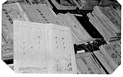
ここにも歴史がある 「ページーページ」に思い出が