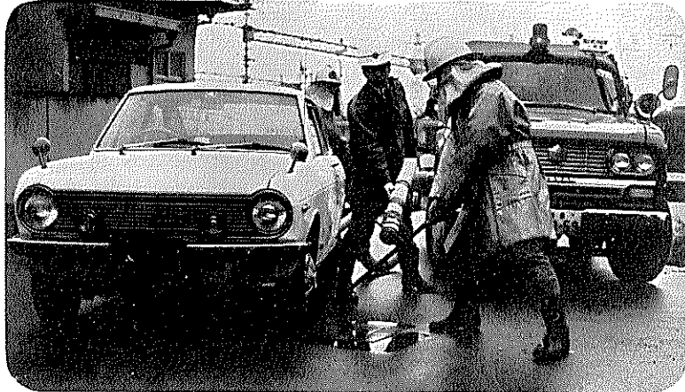
水道消火栓の使用を不能にした不法駐車クルマ