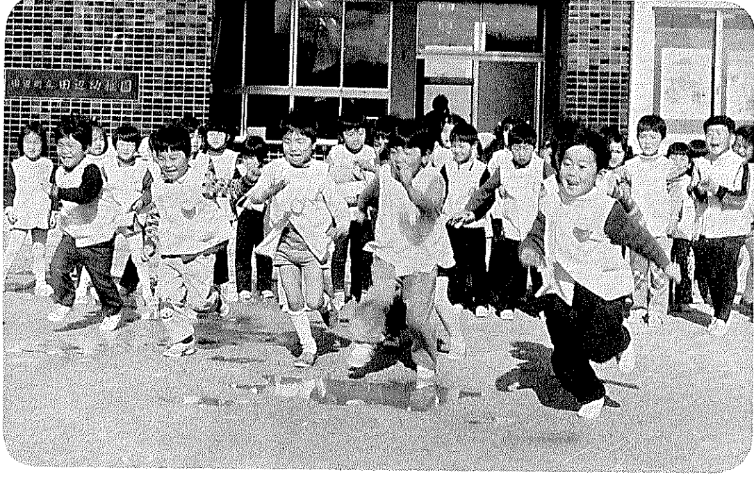
【田辺町住民憲章】 わたくしたちは、老人・子供を 血のかよた町政を!! 温かくいたわり、健康で明るい家庭をきづきましょう!!

いま、町の人口は— (昭和48年2月1日現在) ( )内は1月1日現在 男 12,902人 (12,845) 女 13,224人 (13,188) 計 26,126人 (26,033) 7,188世帯 (7,154)