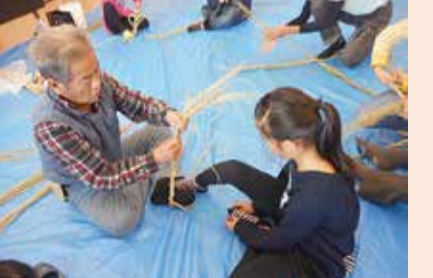
子どもたちに昔ながらのしめ縄飾りの作り方を教える登録者(大住児童館)

要です。 日にち＝12月6日(火)・平成29年3月3日(金)(いずれか1日) 時間＝午後1時30分～4時 場所 ＝市役所 305会議室 内容 ＝活動の進め方、認知症高齢者・障がいのある人・子どもへの接し方、個人情報の保護についてなど 申込方法 ＝来庁か電話で申し込んでください 申込・問合せ先 ＝高齢介護課 (☎64-1373)