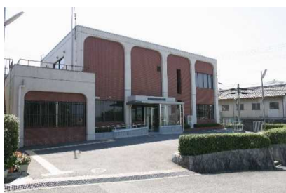
『京田辺市立三山木福祉会館』 各種教室や講座を通じて、福祉の向上と人権教育・啓発の住民交流を図っています。