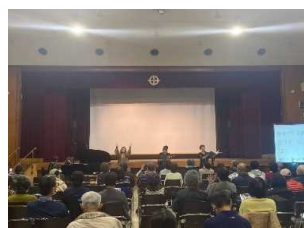
『ヒューマン映画上映会 withトーク&ライブ』