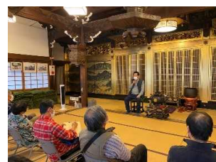
『フィールドワークの実施』