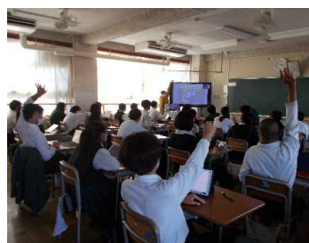
『みんなが自分らしく生きるために』 (子どもを対象とした男女共同参画推進事)