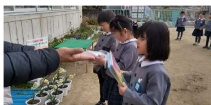
『人権の花』運動 人権擁護委員を中心に、幼稚園児・小学生を対象とした命の大切さを学ぶ活動を実施しています。