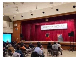
『京田辺市ハートフルフェス』

様々な人権問題に対して理解を深めるために、各種研修会・講座のほか、体験を重視した参加型イベントを企画しています。