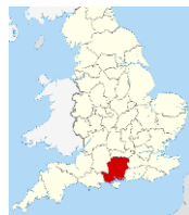
ハンプシャー州 (Hampshire, UK)