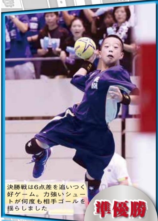
決勝戦は6点差を追いつく好ゲーム。力強いシュートが何度も相手ゴールを揺らしました