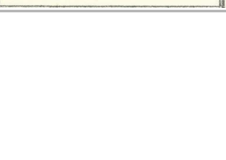
申込・問合せ先 健康推進課(☎64・1335)

定員 先着20人。初めての人を優先し、多数の場合は抽選します 費用 2千円(テキスト・教材費) 申込方法 9月26日(月)までに電話で申し込み 申込・問合せ先 健康推進課(☎64・1335)