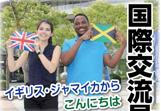
イギリス・ジャマイカからこんにちは