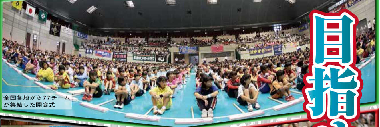
全国各地から77チームが集結した開会式