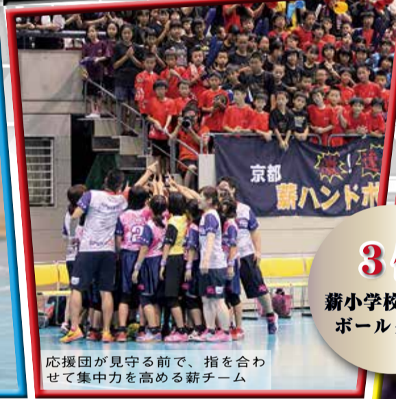
応援団が見守る前で、指を合わせて集中力を高める薪チーム