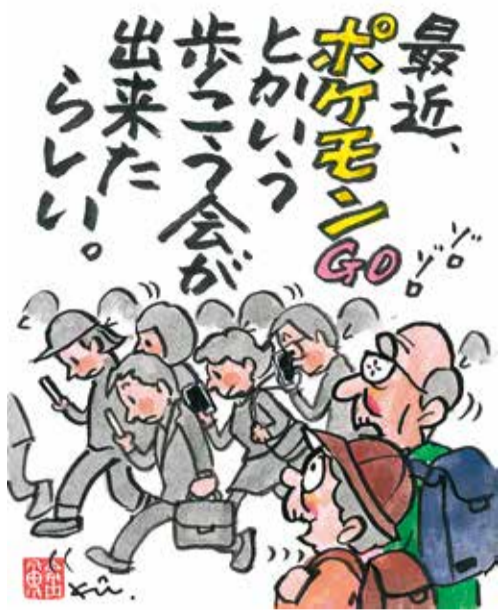
【新・歩行会あらわる！】