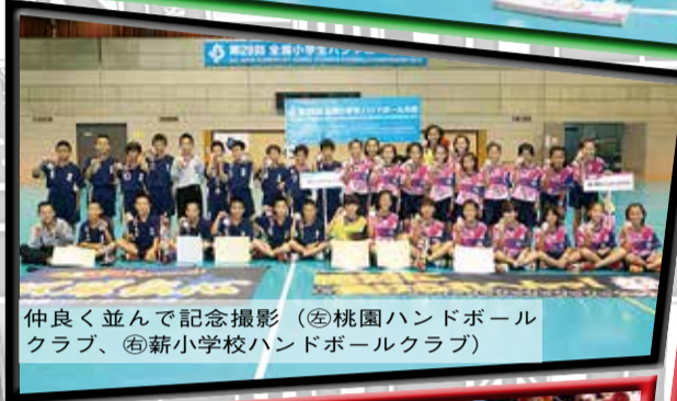
仲良く並んで記念撮影 (◎桃園ハンドボールクラブ、◎薪小学校ハンドボールクラブ)