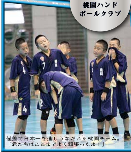
僅差で日本一を逃しうなだれる桃園チーム。「君たちはここまでよく頑張ったよ！」