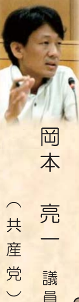
岡本 亮一 議員 (共産党)