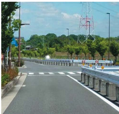
山手幹線の中央に設置されているガードレール (同志社山手)