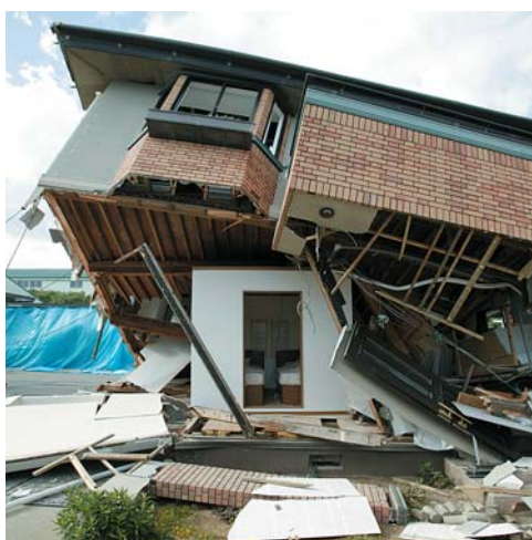
耐震シェルターの実例