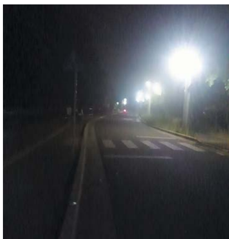
片側しか防犯灯がない道路 (田辺高等学校西側)