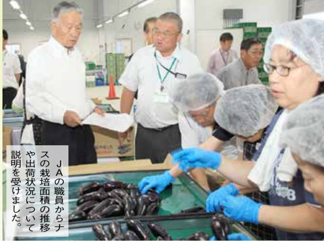
J Aの職員からナスの栽培面積の推移や出荷状況について説明を受けました。

これらの施策により、今年度は栽培面積が増加に転じました。また、良質なナスを安定して供給できるため、価格も維持できています。今後も引き続き、特産品を守る取り組みを進めてまいります。