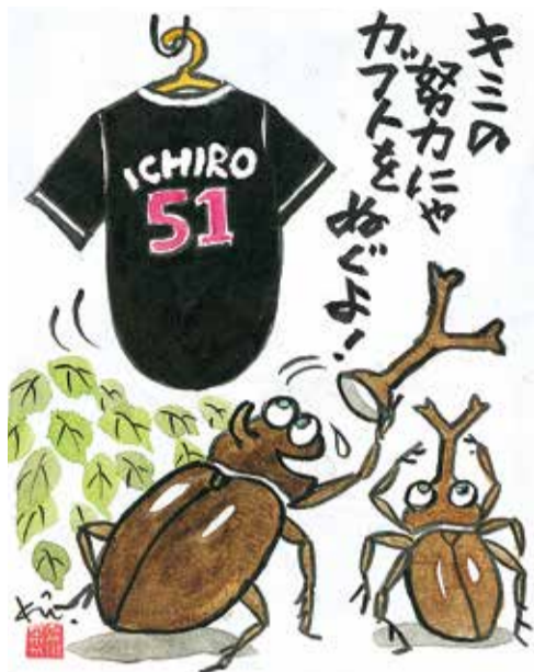
【イチロー 4257 安打】