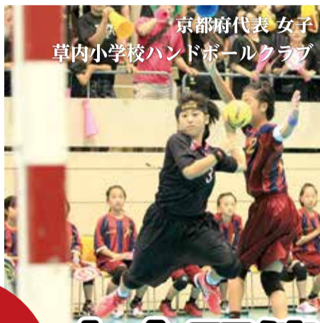
京都府代表女子 草内小学校ハンドボールクラブ