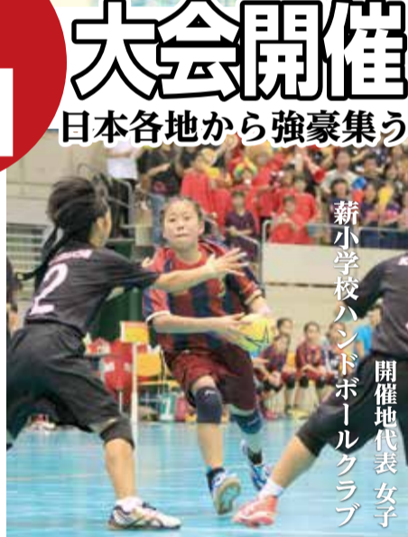
開催地代表女子 薪小学校ハンドボールクラブ