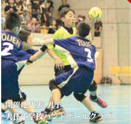
開催地代表男子 大住小学校ハンドボールクラブ