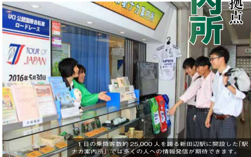
1日の乗降客数約25,000人を誇る新田辺駅に開設した「駅ナカ案内所」では多くの人への情報発信が期待できます。

市政や市内のイベント・観光情報などを案内するほか、京田辺らしい逸品として同協会が認定する「京田辺ブランド一休品」の販売も行います。 新田辺駅を利用する際には、ぜひ立ち寄ってみてください。 【開所時間】 午前9時～午後5時 【問合せ先】 京田辺市観光協会 (☎68・2810)