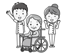
福祉に関するイラスト

健康・福祉 多数の場合は抽選します。 〔申込方法〕 電話で申し込んでください 〔しめきり〕 7月7日(木) 〔申込・問合せ先〕 地域包括支援センターあんな常磐苑 ☎68-1310