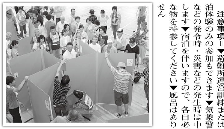
プライバシーを守る間仕切りを組み立てる参加者(昨年の様子)

市は、大規模地震を想定した避難所運営訓練(泊体験)を実施します。避難所生活を知る・学ぶ・考えるきっかけに、避難所の運営や生活を体験しませんか。 日時 8月27日(土)午後2時～28日(日)午前8時 場所 培良中学校 対象 市内に在住する小学校3年生以上。小学生は保護者の同伴が必要です。 内容 避難所開設準備・運営・炊き出し・宿泊体験・消防実技講習など 定員 50人。多数の場合は抽選し、7月22日(金)以降に結果を郵送します。 申込方法 往復はがきの往信用に「避難所運営訓練参加希望」・住所・参加者全員の氏名(ふりがな)・年齢・電話番号を書いて郵送してください しめきり 7月15日(金)〔当日消印有効〕