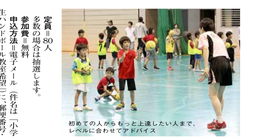
初めての人ももっと上達したい人まで、レベルに合わせてアドバイス

定員↑80人 多数の場合は抽選します。 参加費↑無料 申込方法↑電子メール(件名は「小学生ハンドボール教室希望」)に、郵便番号・住所・氏名(ふりがな)・性別・学校名と学年・ハンドボール経験の有無(なし)・授業のみ・所属チームなど)・緊急連絡先を書いて、けいはんな学研都市活性化促進協議会(メールアドレス handball@keihanna-plaza.co.jp)へ送信してください。 しめきり↑6月15日(水) 問合せ先↑けいはんな学研都市活性化促進協議会(☎55034) ↓企画調整室(☎64・1310)