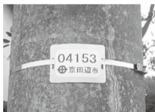
電柱などに設置している管理番号札

によるごみの減量につながります。昨年は、82団体が参加し、年間ごみ総量の1割に当たる2,250トンが再資源化されました。これにより、市は1,350万円(1団体当たり平均16万5千円)の補助金を交付しました。あなたも、ごみを資源に変える地域の再生資源集団回収事業に参加し、ごみの減量に取り組みましょう。問合せ先=清掃衛生課(☎68-1288)