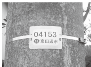
電柱などに設置している管理番号札

市は、市内の防犯灯(約6千300基)をLED照明に交換しました。これまでに区・自治会にお願していた修繕や電気料金の負担などの維持管理業務を、今後は市が行います。【LED照明のメリット】 ▼点灯寿命がこれまでの約2年から約10年となり、修繕