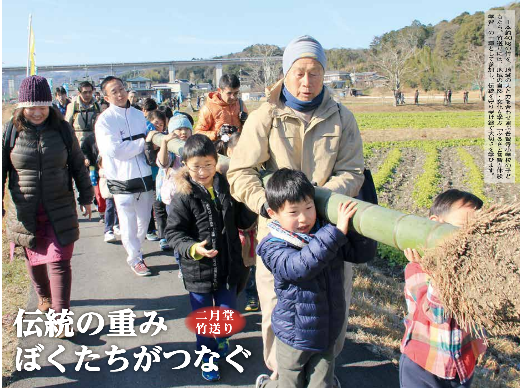
1本約40kgの竹を、地域のひとと力を合わせ運ぶ普賢寺小学校の子どもたち。竹送りには、地域の自然・文化を学ぶ「ふるさと普賢寺体験学習」の一環として参加し、伝統を守り受け継ぐ大切さを学びます。