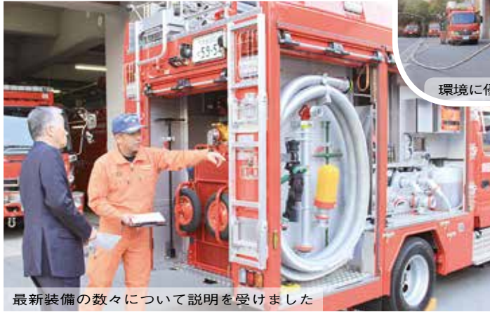
最新装備の数々について説明を受けました