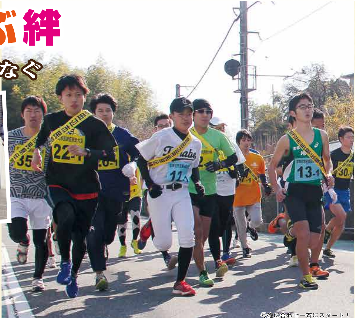
号砲に合わせ一斉にスタート!

1月31日、第32回京田辺市民駅伝競走大会が行われ、34チーム204人が冬の京田辺を縦断しました。同大会のコースは、松井ヶ丘小学校をスタートし、田辺中央体育館・同志社大学京田辺キャンパス西門・普賢寺