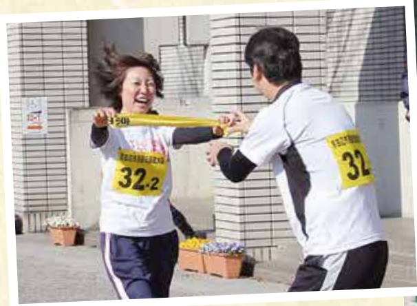
心を一つにたすきをつなぐ(第2中継所)