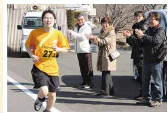
沿道の声援や拍手がランナーの励みに