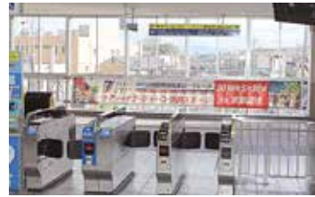
JR京田辺駅改札前の自由通路