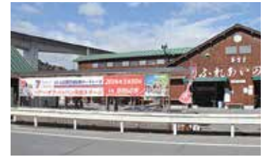
府道生駒井手線沿いにある普賢寺ふれあいの駅