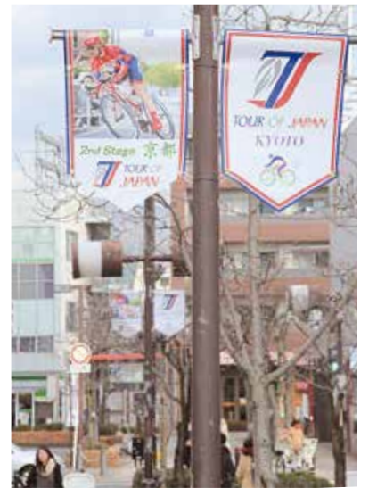
多くの駅利用者が行き交う近鉄新田辺駅とJR京田辺駅の間に、合計34枚のフラッグが並びます