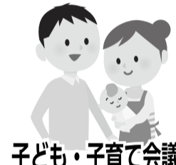
子ども・子育て会議