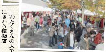
⑥たくさんの方でにぎわう模擬店