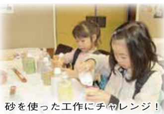
砂を使った工作にチャレンジ!

日にち=11月15日(日) 時間=午前10時~午後3時 場所=中央公民館 駐車場がありませんので、公共交通機関で来場してください 内容=サンドアートと紙すき体験・葉っぱで絵カード作り・自転車安全運転シュミレーター体験・環境活動紹介の展示・緑のカーテン写真展・「もったいない」子どもポスター展・手回し発電体験・旬の野菜市・パンの販売など