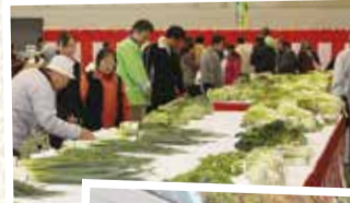
⑤品評会に出品した農産物が並びます