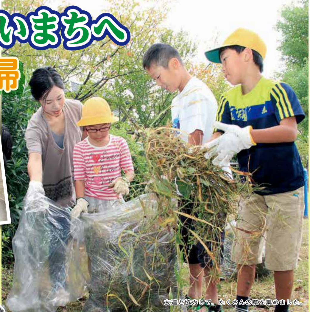
友達と協力して、たくさんの草を集めました。