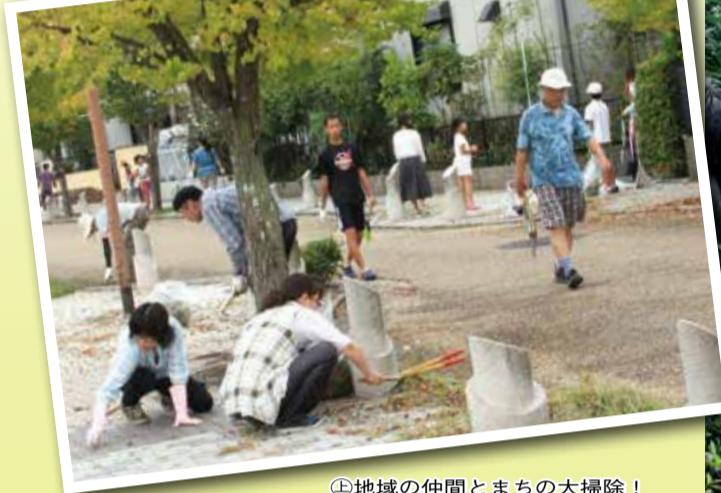
④地域の仲間とまちの大掃除!