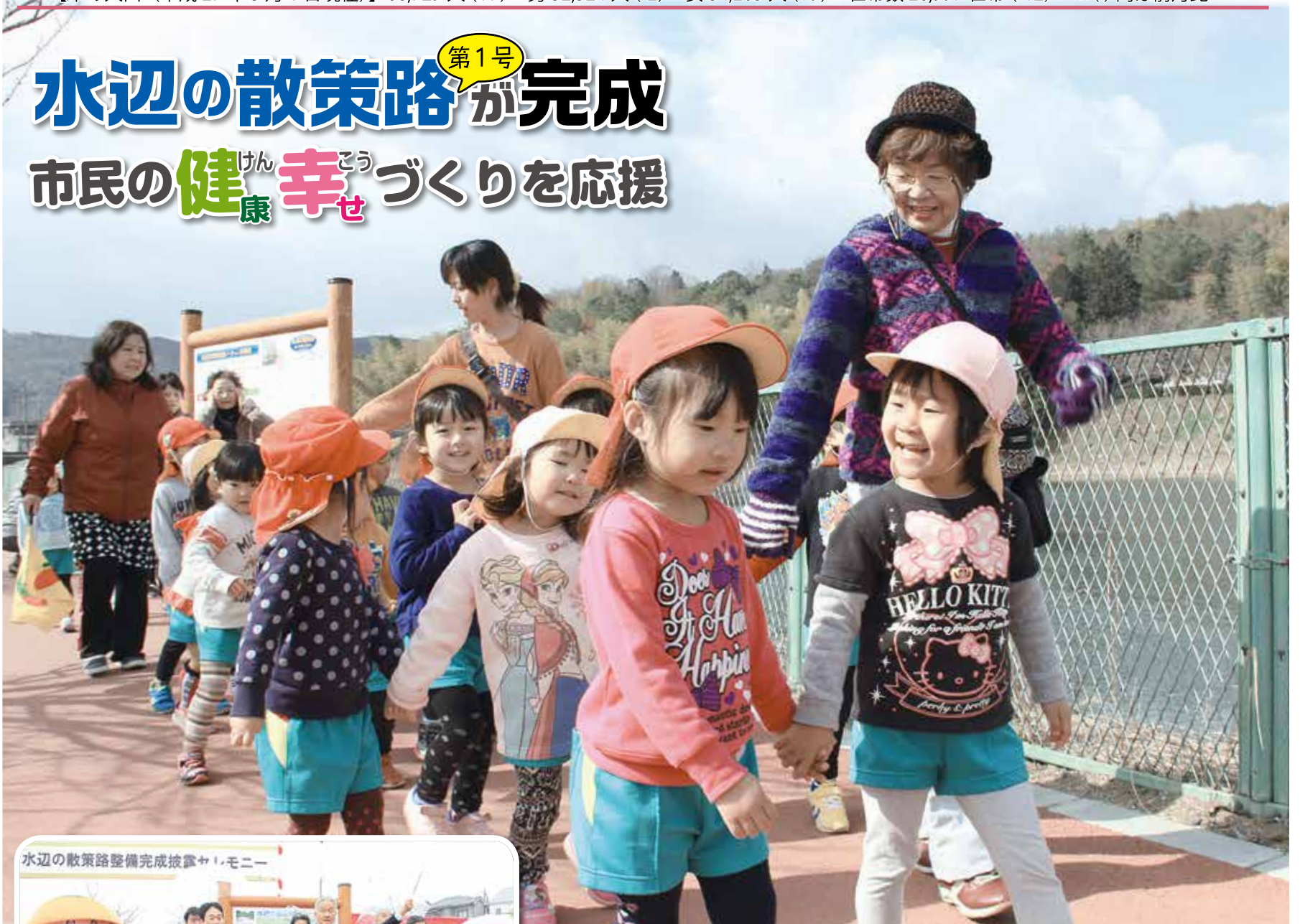
水辺の散策路整備完成披露セレモニー