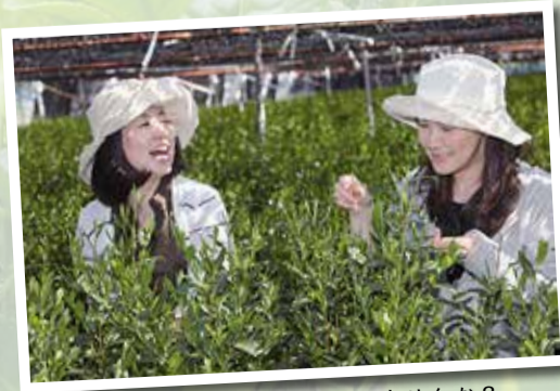
「玉露日本一」に一役買ってみませんか？

数名で申し込む場合は、備考欄に誰と一緒に書いてください。 しめきり 4月12日(日) 申込・問合せ先 農政課（〒610-0393（住所不要）、☎64-1362、FAX 64-1359、メールアドレス nousei@kyotanabe.）