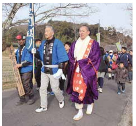
東大寺二月堂へ、いざ出発！