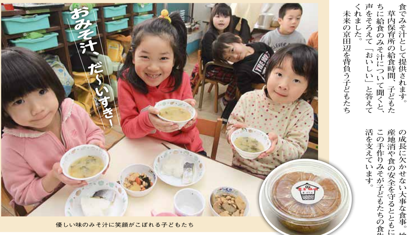
おいしい味のみそ汁に笑顔がこぼれる子どもたち

天王地区の主婦グループ「天王生活教室」による、手作りみその仕込みがピークを迎えています。市では、市立小学校9校、保育所4所すべての給食で出る「みそ汁」に、この手作りみそを使っています。 同教室は、現在13人のメンバーに、地域の若い主婦6人も手伝いとして加わり活動しています。 12月から始まったみそ造り。1日約60kgを仕込み、3月までに約3トンを造ります。天王地区で生産された米と国産大豆で造るみそは、昔ながらの田舎みそと呼ばれるものです。今まで保存しやすい少し塩辛いみそが主流でしたが、健康のことを考え減塩みそにレシピを変更。今では、素材の味を生かした優しい味が特徴です。 仕込んだみそは、約9カ月間熟成され、秋には各小学校、保育所の給