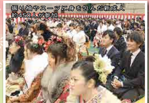
振り袖やスーツに身を包んだ新成人 約450人が参加