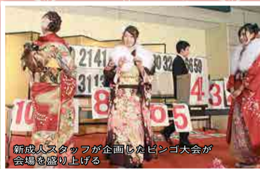
新成人スタッフが企画したビンゴ大会が会場を盛り上げる