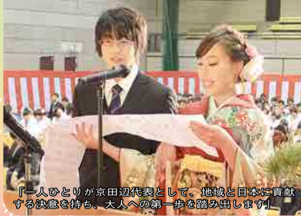
「一人ひとりが京田辺代表として、地域と日本に貢献する決意を持ち、大人への第一歩を踏み出します」

1月11日、田辺中央体育館で成人式が行われ、華やかな振り袖やスーツに身を包んだ新成人の新たな門出を祝いました。今年、市内で大人の仲間入りをした新成人は737人。式典後には、新成人スタッフ6人が企画した「成人のつどい」が開かれ、お笑い芸人のステージやビンゴ大会を楽しんだり、恩師や旧友との再会を懐かしむ姿がありました。