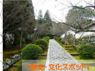
【歴史・文化スポット】 酬恩庵一休寺

現在散策路の環境整備を進めている手原川堤防道路の区間です。カラーアスファルト舗装やベンチ、その他健康や観光を意識した整備を行います。