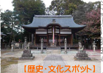
【歴史・文化スポット】 棚倉孫神社