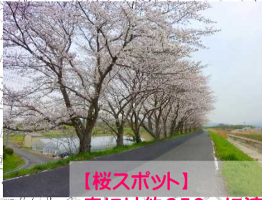
【桜スポット】 春には約250mに渡り 桜が咲き誇ります