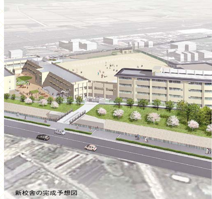
新校舎の完成予想図

11月5日、三山木小学校の西校舎棟新築等工事の安全祈願祭が執り行われ、同校の新築・改修工事が始まりました。 多くの自治体が人口の減少傾向を迎えている中、京田辺市では今なお人口が増加しています。特に、南部地域は、三山木駅前の区画整理事業が最終段階を迎え、同志社山手地域も開発が進み、ますます人口の増加が予想されます。 今回の工事は、南部地域の児童数の増加に対応し、安全・安心で充実した教育環境を提供するため、校舎の新築と既存校舎の大規模改修を行うものです。 そのほか、通学路の安全確保のため、遠藤川に橋を架け、新たに学校北側に校門を設けます。また、広域避難所となっている同校の体育館などを防災の拠点としてさらに整備を進めます。 今後平成27年度までに西校舎棟・給食棟を建設。平成29年度までに、東校舎の大規模改修などを行う予定です。 問合せ先 Ⅱ 学校環境整備課 (☎64・1393)