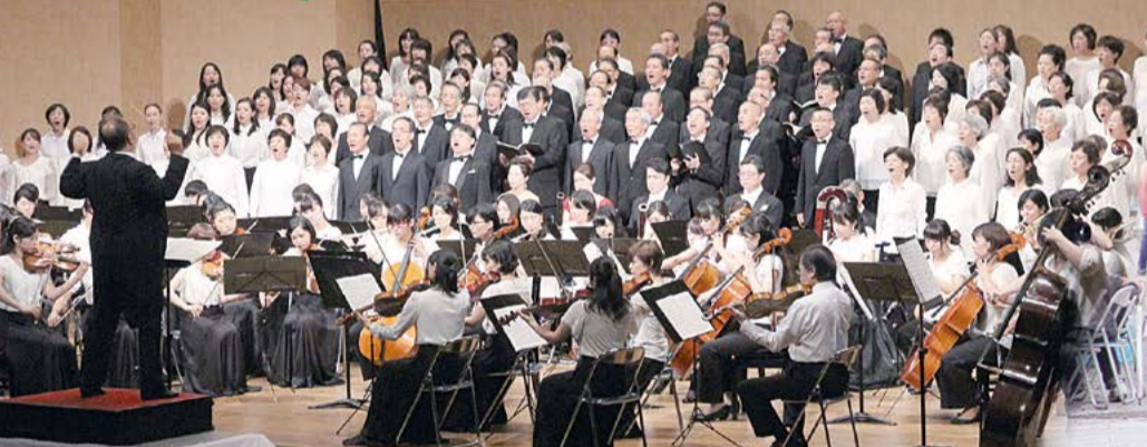
同志社女子大学新島記念講堂で行われた「第九」コンサート。同大学の音楽学科管弦楽団の演奏と約180人の市民合唱団の歌声が会場に感動を与えました。