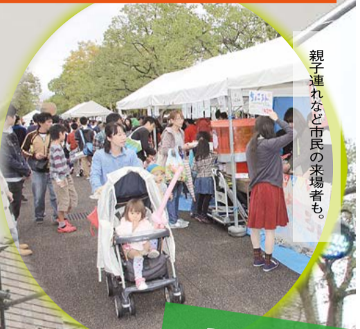
親子連れなど市民の来場者も。

11月1・2日、京田辺市の秋の祭典「同志社クローバー祭(1・2日)」「市民文化祭(1・2日)」「第九コンサート(2日)」などが開かれ、緑豊かな自然と、文化が彩る京田辺をたくさんの方が楽しみました。市民も学生も学園祭を楽しんだ同志社クローバー祭。ステージを飾った普賢寺幼稚園の園児は、楽しいダンスで会場を沸かせました(=写真)。