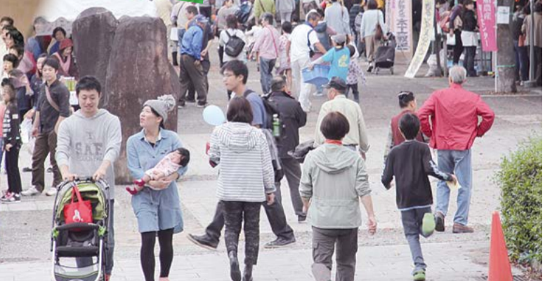
毎年、体験コーナーや模擬店が並ぶ中央体育館周辺。2日間、たくさんの来場者でにぎわいました。