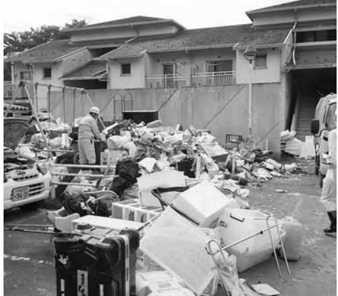
福知山市の浸水被害後、大量に集積された廃棄物

合で提案した中で、考えていきたい。 問 自治体や民間が主体となる事業仕分けを実施しては、 企画政策部長 導入中の事務事業評価と目指す方向性は同じと認識している。今後、より客観的な視点で評価できるシステムとなるよう研究していきたい。 問 ハザードマップ改定は、 危機管理監 内閣府が策定したガイドライン改定に合わせて対応したい。 問 避難時の注意喚起の周知徹底を、 危機管理監 国の調査では、