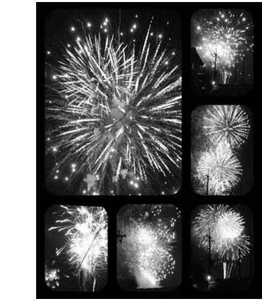
夕涼みの集いで打ち上がった花火

質問は9月10日、11日、12日の3日間で行いました。 (質問の順序は抽選で決められ、その順に各議員から提出された要約原稿のとおり掲載しています。)