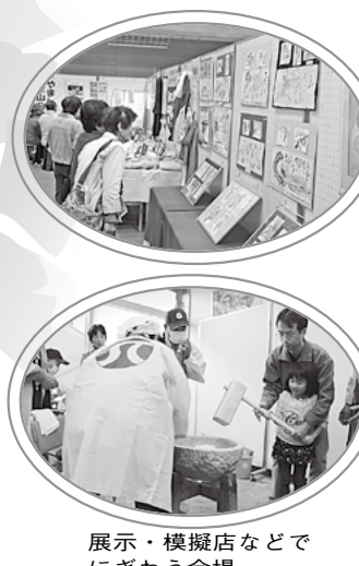
展示・模擬店などにぎわう会場

日にち=11月8日(土)・9日(日) 時間=午前10時～午後4時(9日は午後3時まで) 場所=中部住民センター 駐車場に限りがありますので、公共交通機関で来場してください。 内容=舞台発表・展示・模擬店・フリーマーケット・体験教室など 問合せ先=中部住民センターまつり実行委員会事務局(中部住民センター内、☎ 64-8810)