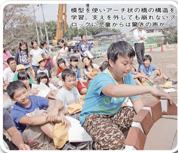
模型を使いアーチ状の橋の構造を学習。支えを外しても崩れないブロックに児童からは驚きの声。

10月1日、三山木小学校6年生が、新しく架かる橋の工事現場の見学を行いました。 この橋は、同校の北側を流れる遠藤川に架かり、平成28年4月の校舎新築に併せて建設が進められています。完成後は、府道に面する正門へ回ることも安全に学校北側から登下校ができるようになります。