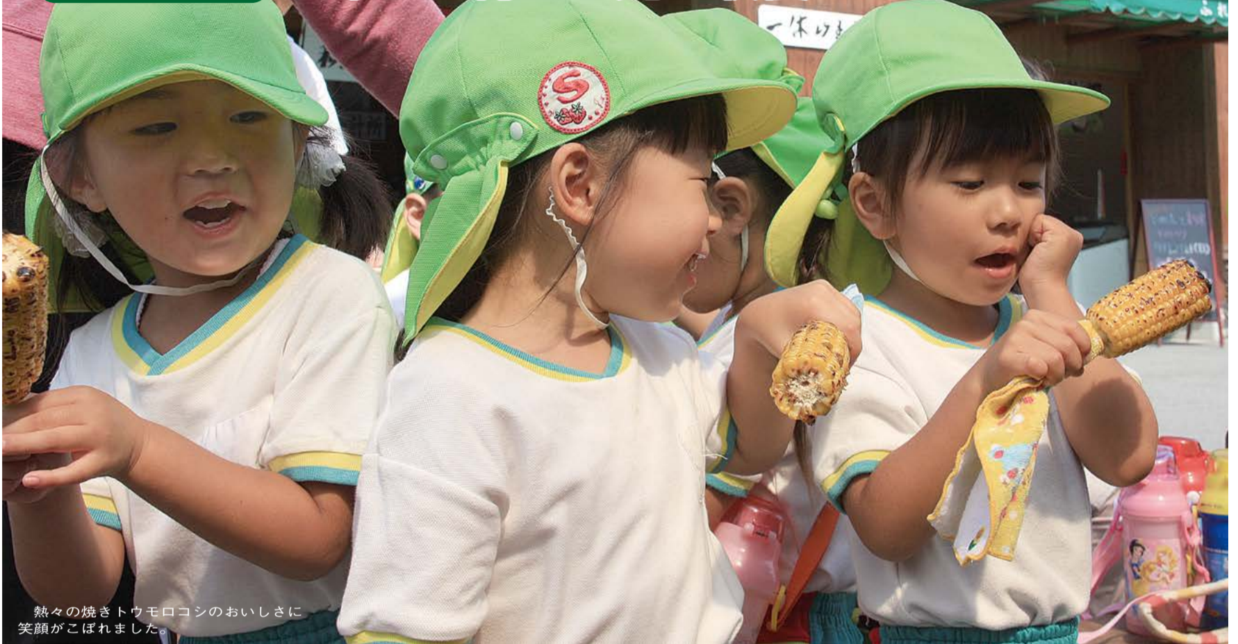
熱々の焼きトウモロコシのおいしさに笑顔がこぼれました。