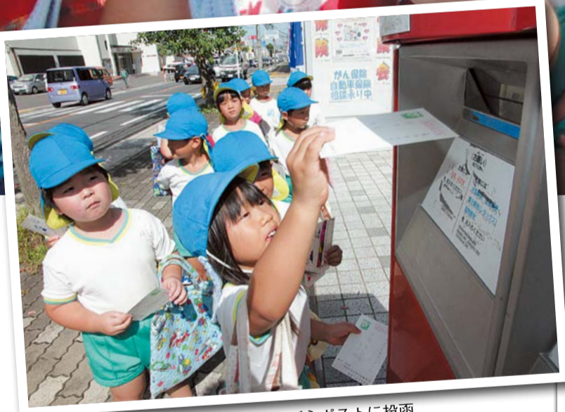
背伸びをしながらポストに投函

敬老の日を前にした9月12日、田辺幼稚園5歳児29人は、おじいちゃん・おばあちゃんに宛てた絵はがきを、山城田辺郵便局で投函しました(1写真)。 絵はがきは、幼稚園で楽しかった出来事やおじいちゃん・おばあちゃんに似顔絵を元氣いっぱい描いたもの。余白には、「げんきしていますか」「またあそんでね」「ようちえんたのしいよ」などの温かいメッセージが添えられていました。