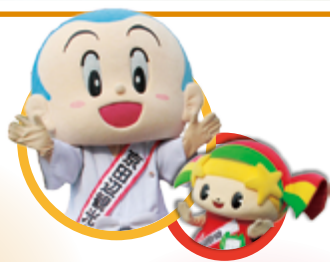
京田辺観光大使の一休さん・キララちゃんに応援に来るよ!

京田辺の秋を楽しみながら、歩く気持ち良さを感じることが出来るイベントです。自然と名所・旧跡を巡りながら健康づくりに取り組んでみましょう。 時間 午前9時15分から。受け付けは午前8時30分から コース ①初心者コース(約6km) ②一般コース(約11km) ③健脚コース(約17km) 酬恩庵一休寺や国宝十一面観音立像が安置される大御堂観音寺などを巡ります。酒屋神社では甘酒の無料接待、普賢寺ふれあいの駅ではお茶のおもてなしもあります。 参加費 (1人) 1100円。当日300円。中学生以下は無料 申込方法 往復はがきの