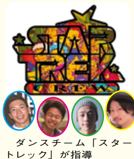
ダンスチーム「スター・トレック」が指導

遊びスポーツ(ミニトランポリン・跳び箱・マットなど) ▼スポーツラリー▼エア遊具▼パネル展▼模擬店▼プール無料開放 問合せ先=NPO法人京田辺市社会体育協会事務局(☎29-9008)