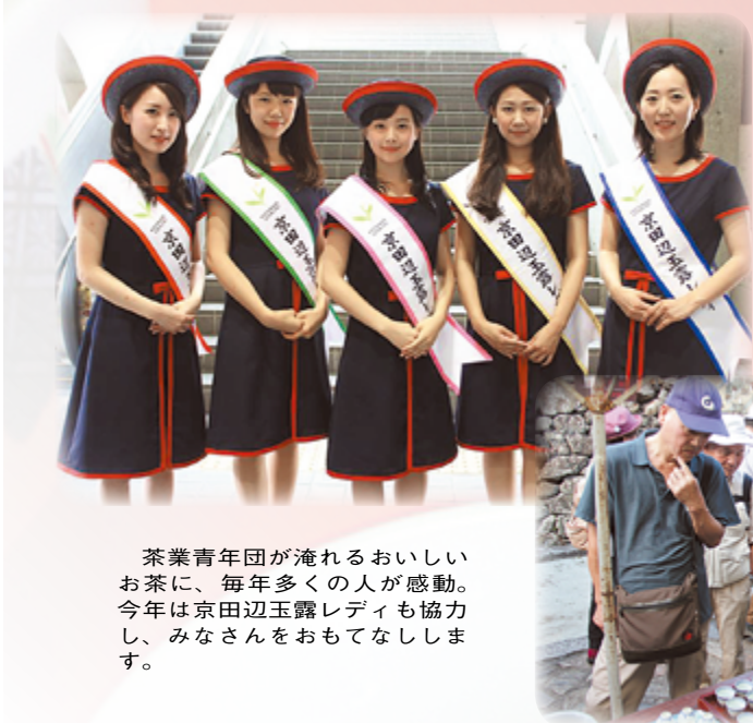
茶業青年団が淹れるおいしいお茶に、毎年多くの人々が感動。今年は京田辺玉露レディも協力し、みなさんをおもてなしします。

また、今年結成した京田辺玉露をPRする「京田辺玉露レディ」があなたのお越しをお待ちしています。