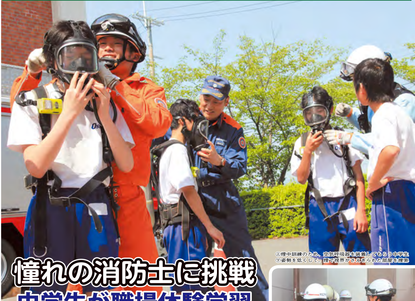
①煙中訓練のため、空気呼吸器を装着してもらう中学生 ②姿勢を低くして、煙で視界がさげられた部屋を搜索

発行／京田辺市 〒610-0393 京都府京田辺市田辺 80 ☎(0774) 63-1122 FAX (0774) 63-4781 田 http://www.kyotanabe.jp/ 【市の人口（平成26年6月1日現在）】66,317人(+44) 男32,270人(+13) 女34,047人(+31) 世帯数26,739世帯(+33) ※()内は前月比