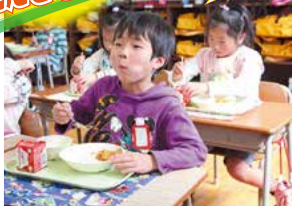
一口頬張り笑顔の児童(田辺東小学校)

この春、9つある市立小学校へ752人が希望を胸に入学しました。4月15日には、新1年生にとって初めての給食が始まりました。