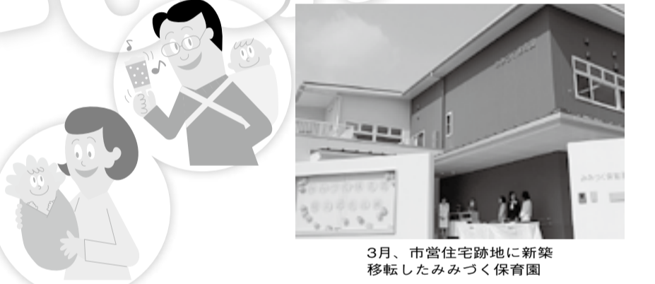
3月、市営住宅跡地に新築移転したみみづく保育園

市では、子育て中のお母さん、お父さんを応援するため、さまざまな施策に取り組んでいます。今年3月、待機児童ゼロを実現するため、市有地を提供し新築移転を支援していた私立みみづく保育園が完成。4月からは、田辺東幼稚園の園舎を利用した河原保育所の分園を増やし、両園で保育定員を約100人増やすなど計画に取り組みできました。また、平成25年から、病児保育サービスを始め、仕事と子育ての両立を希望する若い世代のニーズに応える事業も進めています。 さらに、就園前の子どもを持つお母さんが一人で子育てに悩まないよう、地域子育て支援センターや子育てひろば「ふてふて」で、保育士による相談やお母さん同士が語り合える場をつくるサポート事業も積極的に取り組んでいます。