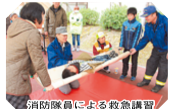
消防隊員による救急講習