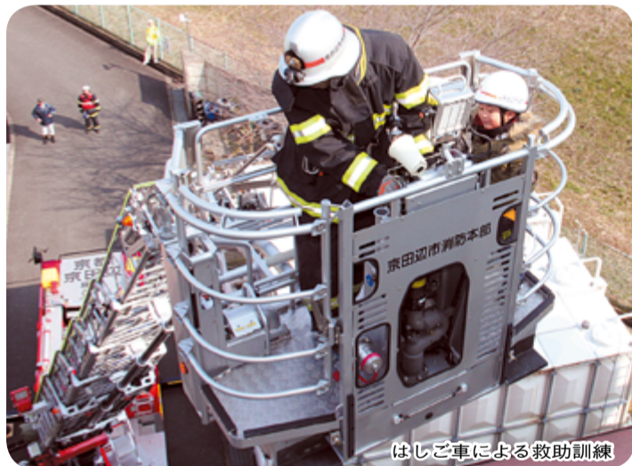
はしご車による救助訓練