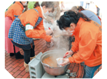
非常食として出された炊き出し