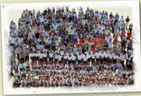
地域のみなさんが支えてくれました

初めて黒豆を育てて、本当に大変だということが分かりました。たくさんのお知恵と体力が必要だと思いました。でも、作業するにつれ新しい知識が増えて、だんだん楽しく感じるようになりました。私