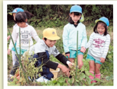
「こうすると簡単に取れるよ」幼稚園児に優しくアドバイス

◆あおぞらグループ◆ あおぞらグループでは、1〜6年生が一緒に活動します。6年生がリーダーになり、メンバー同士仲良くできるように工夫します。 4月、新1年生を迎え「グループびらき」を行います。7月は、緑の風作業所・ふくろう工房のみなさんと夏祭りを、10月の運動会では「赤白対抗綱引き」の中で、全学年で声を掛け合い綱を引きました。1月31日には大縄跳び大会を行い、高学年が低学年に「八の字跳び」