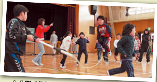
3分間で何回跳べる？新記録にチャレンジ

小規模特認校・普賢寺小学校では、1〜6年生がグループで活動する「あおぞらグループ」や、6年生が地域の人と農業体験する「畑の学校」など特色ある授業があります。今号で最終回となる普賢寺小ニュースでは、6年生が今までの学校生活を振り返りながら紹介します。 問合せ先▶▶普賢寺小学校(☎65・0053)▶▶教育総務室(☎64・1391)