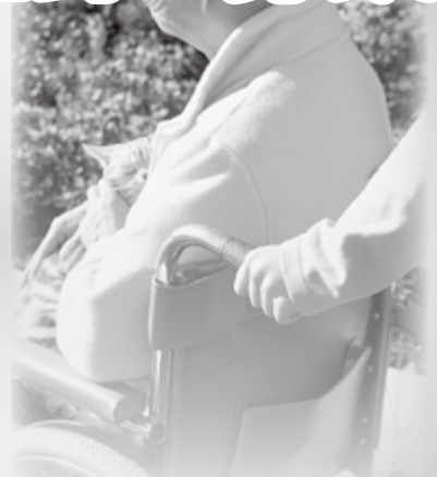
約1時間で1ポイント(100円相当)を加算し、年間上限5,000円の交付金に交換できます。 申込・問合せ先＝高齢介護課(☎64-1373)