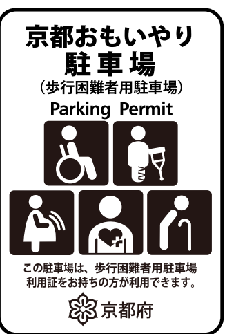
京都おもいやり駐車場は、この看板が目印です。