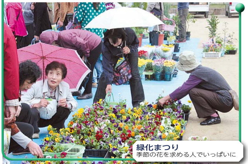
緑化まつり 季節の花を求める人でいっぱい