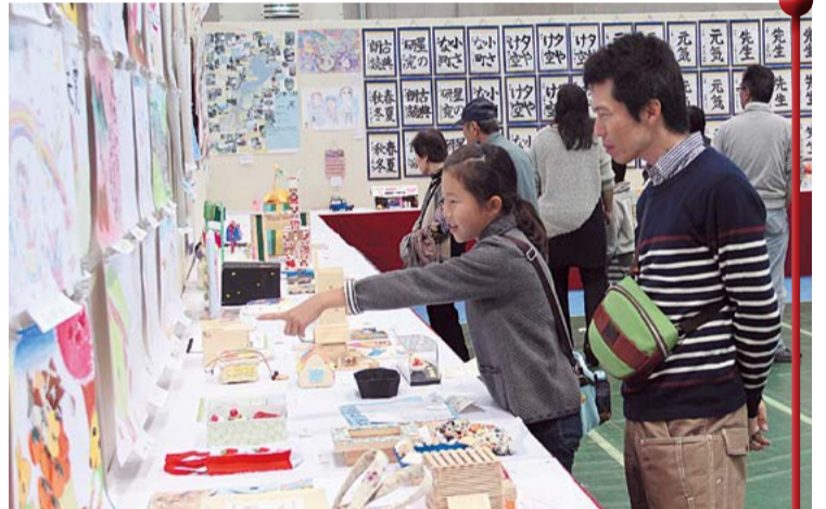
⑥市民文化祭の展示コーナーには見応えたっぷりの作品