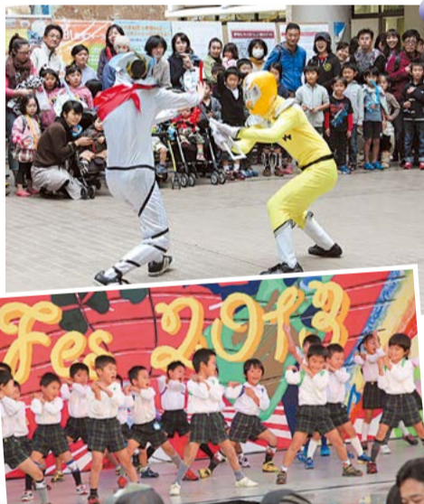
同志社クローバー祭 ④かわいい動物と触れ合える移動動物園⑤同志社戦隊タナレンジャーの格闘シーンに大興奮⑥松井ヶ丘幼稚園の子どもたちがソーラン節を披露