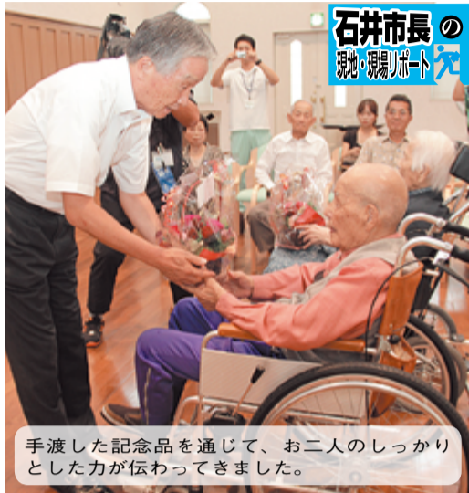
手渡した記念品を通じて、お二人のしっかりとした力が伝わってきました。