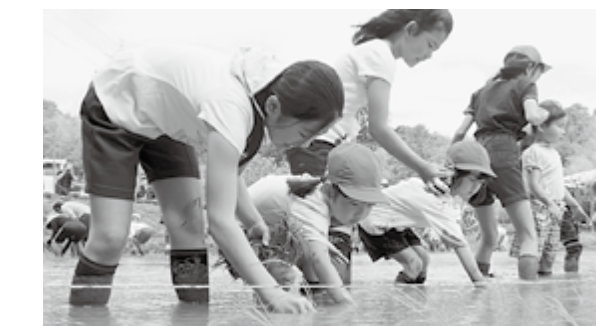
季節に合わせた体験学習で田植えに挑戦する児童